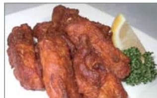
手羽中の唐揚げ (6本) .....550円