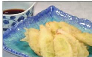
長ネギの衣揚げ (8個) .....550円