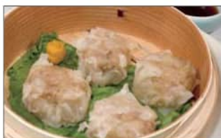
中華街の肉焼売 (4個) .....550円