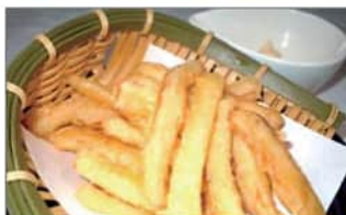
さきいかの天ぷら .....550円