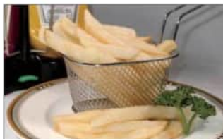
フライドポテト .....550円