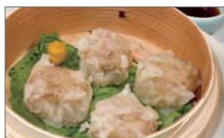
中華街の肉焼売 (4個) .....550円