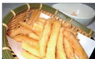
さきいかの天ぷら .....550円