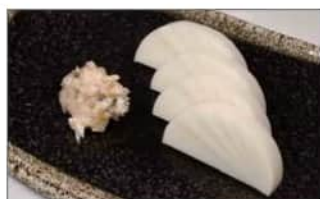
板わさ (4切) .....550円