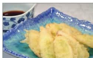
長ネギの衣揚げ (8個) .....550円