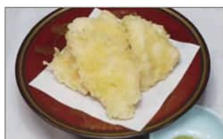
とり天 (4切) .....550円