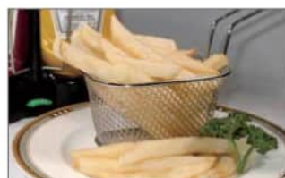
フライドポテト .....550円