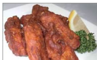
手羽中の唐揚げ (6本) .....550円